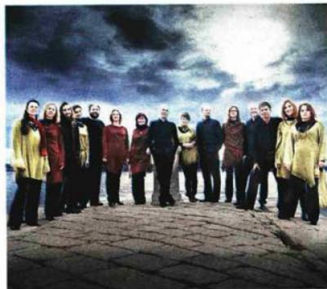
Ars Cantabile – ansambl koji koncertom krajem veljače želi pokrenuti pripreme za kandidaturu

Da je Zadar jedan od gradova koji su zainteresirani